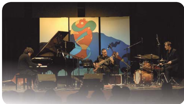
Création : Elodie Maubrun. Traduction : Neil Carmody

Mario Stantchev 33 (0)660 68 94 37 Roland Merlinc 33 (0)661 86 54 40 Site : http://mariostantchev.com